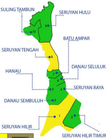
Keterangan warna Peta