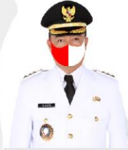
YULHAIDIR Bupati Seruyan Setahu Ketua Gugat Tugas Penanganan Covid-19 Kabupaten Seruyan