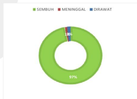
PERSENTASE KONDISI PASIEN COVID-19 KABUPATEN SERUYAN

sumber data : Media Center Satuan Tugas Seruyan