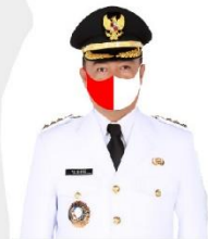
YULHAIDIR Bupati Seruyan Seksiur Ketua Satuan Tugas Penanganan Covid-19 Kabupaten Seruyan