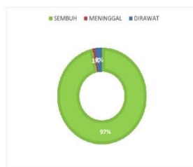
PERSENTASE KONDISI PASIEN COVID-19 KABUPATEN SERUYAN

sumber data : Media Center Satuan Tugas Seruyan