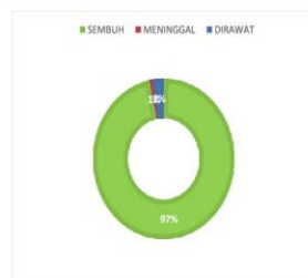
PERSENTASE KONDISI PASIEN COVID-19 KABUPATEN SERUYAN