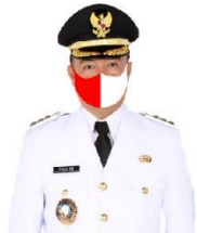
YULHAIDIR Bupati Seruyan Salaku Ketua Gugus Tugas Penanganan Covid-19 Kabupaten Seruyan

SULING TAMBUN SUSPEK = 0 KONFIRMASI = 0 SEMBUH = 0 MENINGGAL = 0