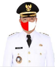
YULHAIDIR Bupati Seruyan Sekeloa Kotaku Gugus Tugas Penanganan Covid-19 Kabupaten Seruyan