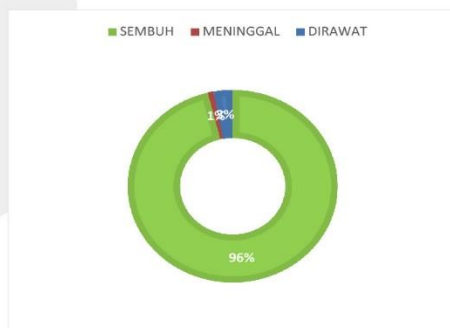
PERSENTASE KONDISI PASIEN COVID-19 KABUPATEN SERUYAN