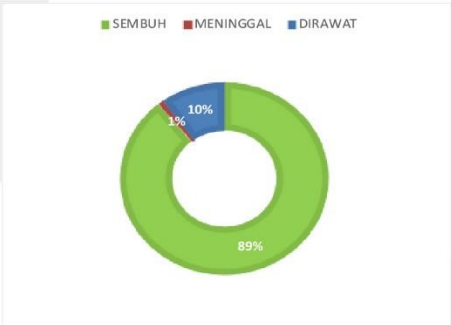
PERSENTASE KONDISI PASIEN COVID-19 KABUPATEN SERUYAN