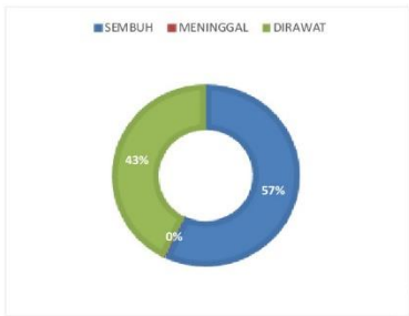
PERSENTASE KONDISI PASIEN COVID-19 KABUPATEN SERUYAN

sumber data :Media Center Satuan Tugas Seruyan