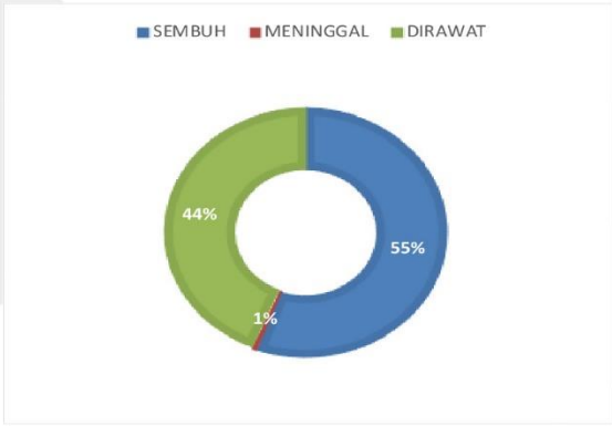
PERSENTASE KONDISI PASIEN COVID-19 KABUPATEN SERUYAN