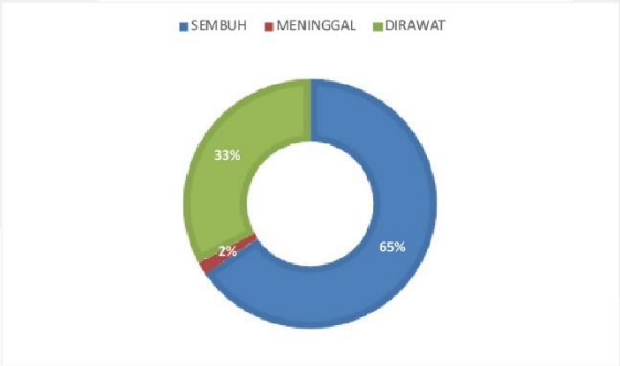
PERSENTASE KONDISI PASIEN COVID-19 KABUPATEN SERUYAN

sumber data : Media Center Satuan Tugas Seruyan