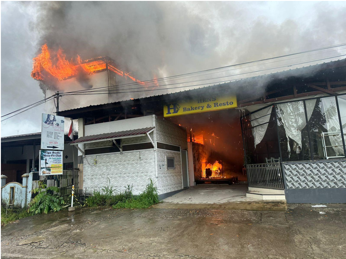
Dokumentasi Kebakaran Bangunan di kab. Bulungan