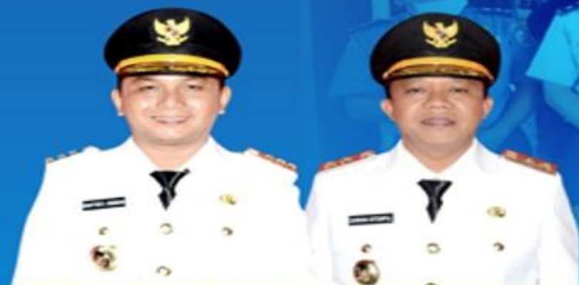
BAKHTIAR AHMAD SIBARANI BUPATI TAPANULI TENGAH

UPDATE DATA PASIEN PADA TANGGAL 2 MEI 2020