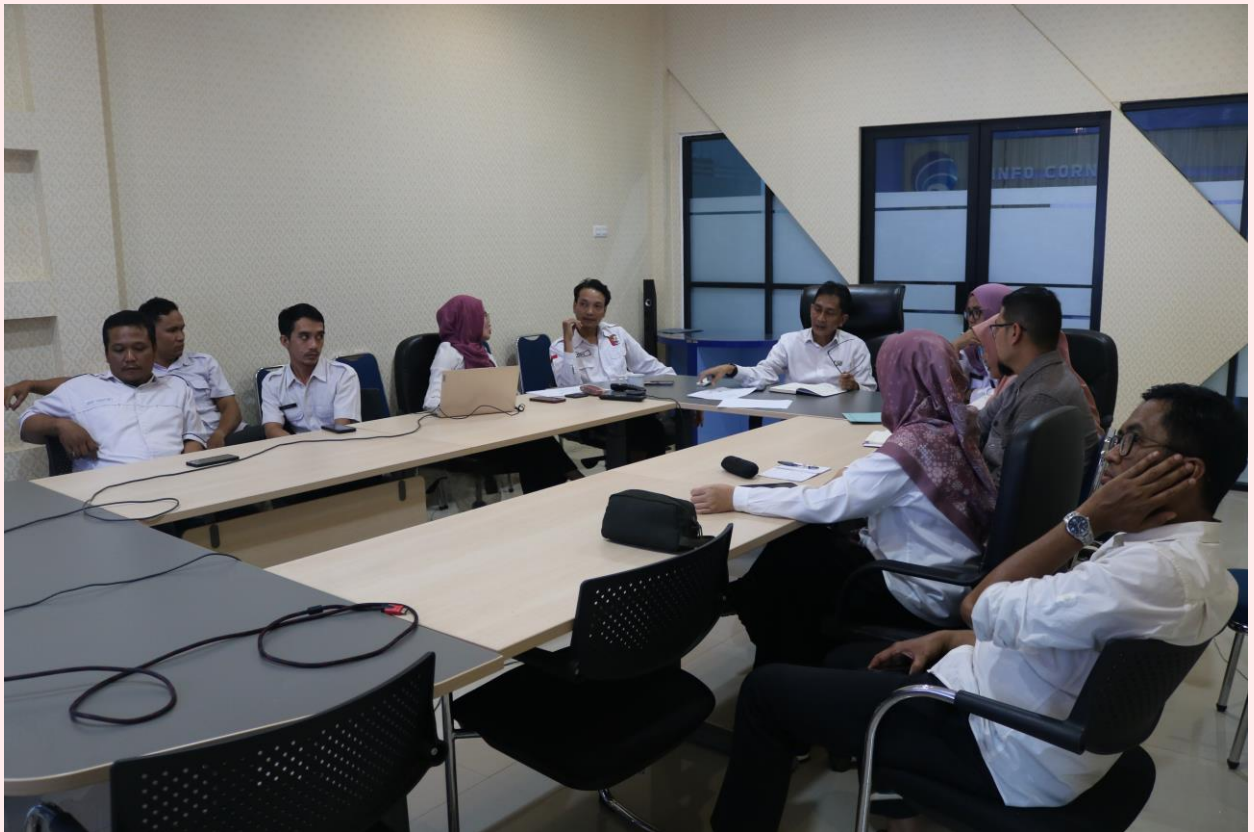
Rapat Pembahasan Anggaran Dalam Rangka Transparansi dan Akuntabilitas Anggaran