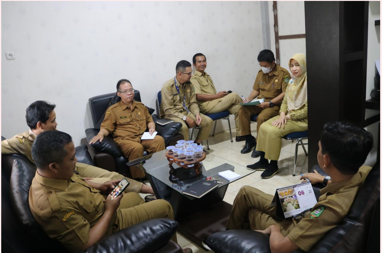
Rapat Pejabat Struktural di Lingkungan Diskominfo Kota Singkawang Yang Dilaksanakan Sebagai Upaya Pelaksanaan Kegiatan Agar Berjalan Dengan Lancar