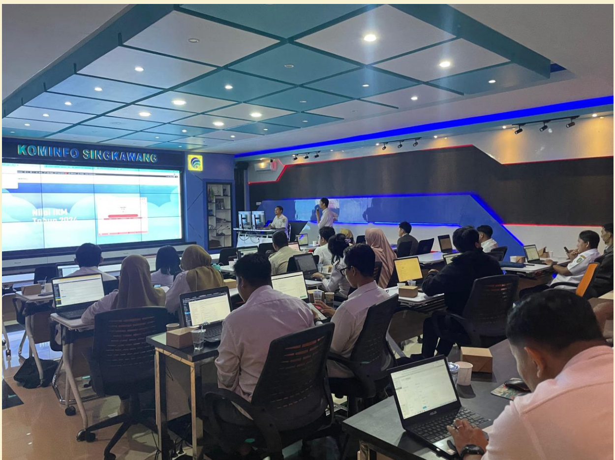
Pelatihan Website Yang Diikuti Oleh Organisasi Perangkat Daerah (OPD) se Kota Singkawang