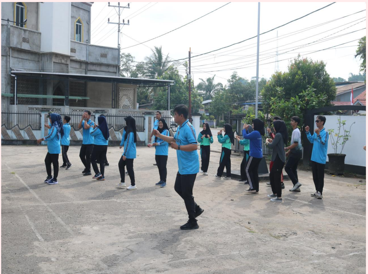
Senam Sehat Yang Dilaksanakan Setiap Hari Jumat