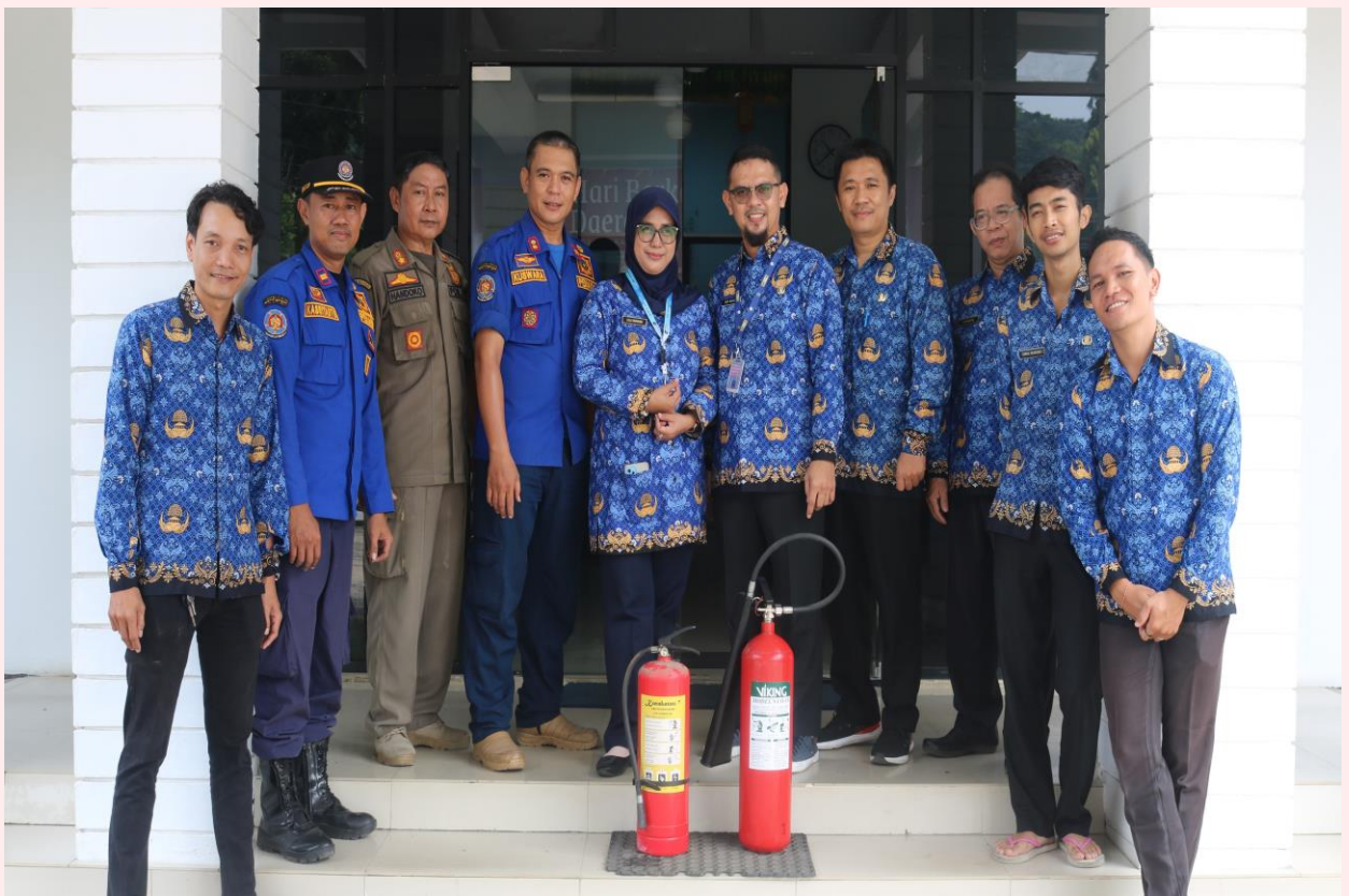
Inspeksi Oleh Bidang Damkar Pol PP Kota Singkawang Terhadap Keselamatan Dan Kesehatan Kerja (K3) di Lingkungan Diskominfo Kota Singkawang