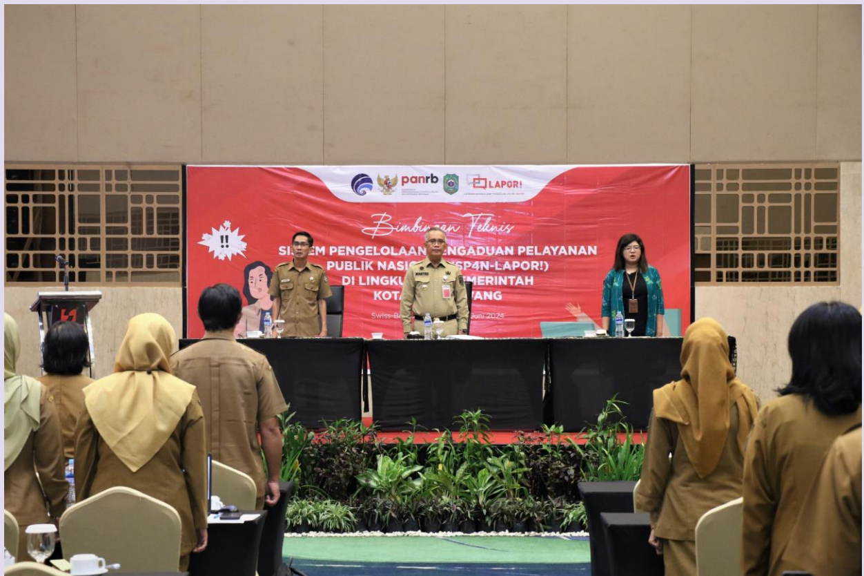
Bimtek Sistem Pengelolaan Pengaduan Pelayanan Publik Nasional (SP4N-LAPOR!) di Lingkungan Pemerintah Kota Singkawang