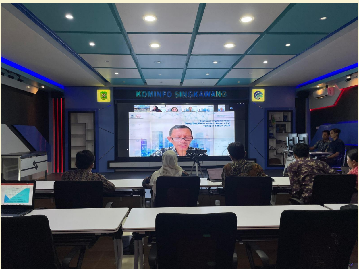
Evaluasi dan Implementasi Program Kota Cerdas (Smart City) Tahap II Tahun 2024