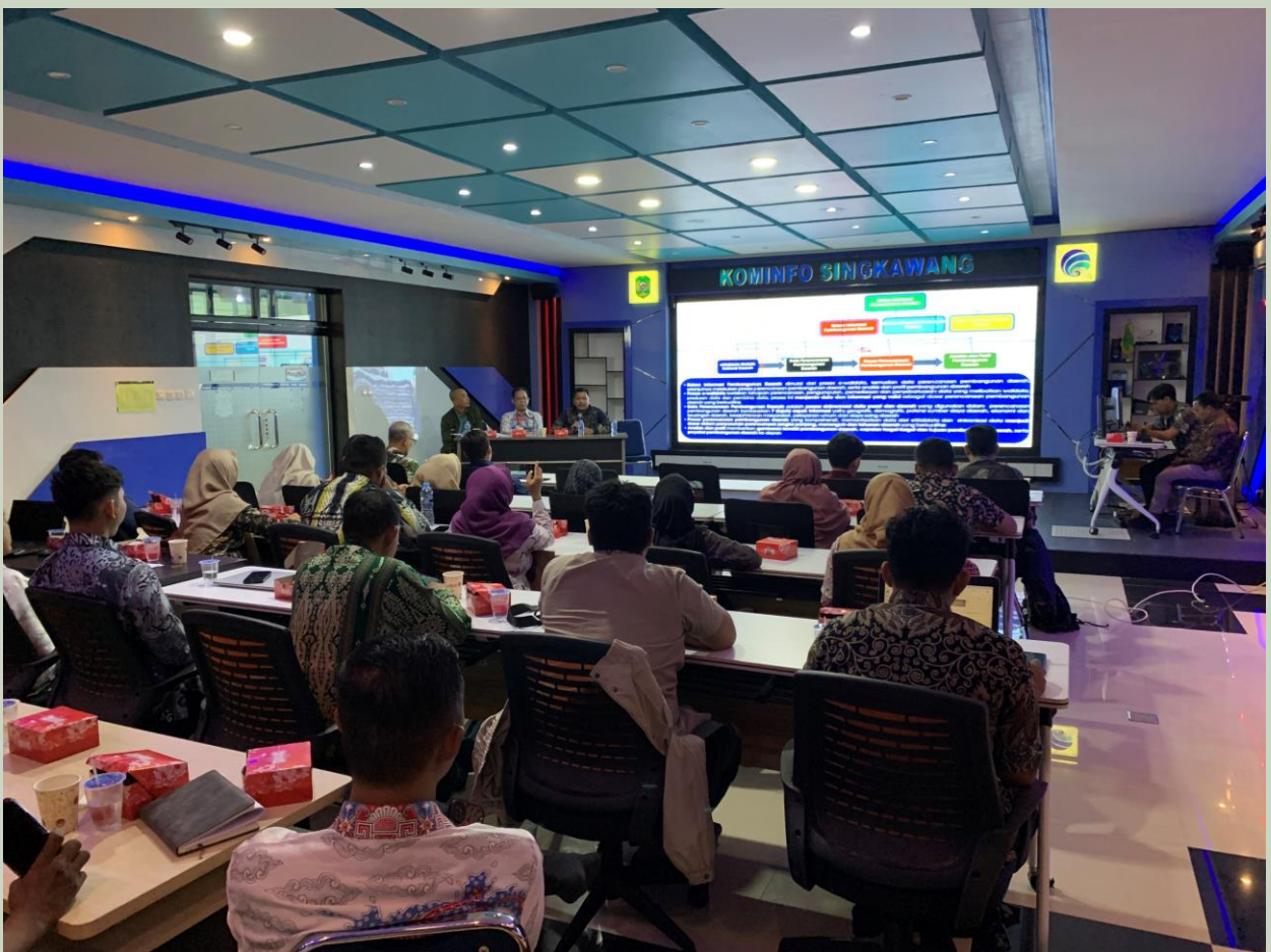
Sosialisai Penerapan Prinsip Satu Data Indonesia E-Walidata SIPD