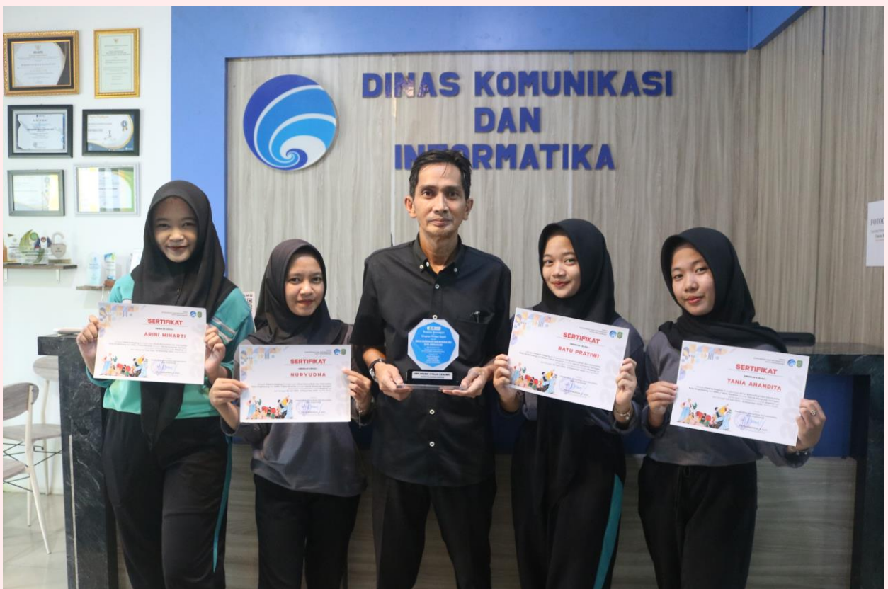
Dengan Menjadi Tempat Magang/Praktek Kerja Lapangan, Instansi Pemerintah Berkontribusi Pada Pengembangan Sumber Daya Manusia Dengan Memberikan Pengalaman Praktis Kepada Pelajar.