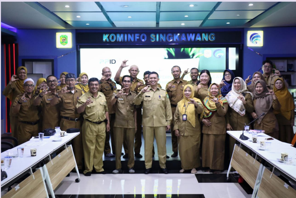
Rapat Koordinasi PPID (Pejabat Pengelola Informasi Dan Dokumenatsi ) Se Kota Singkawang yang Dihadiri OPD (Organisasi Perangkat Daerah)