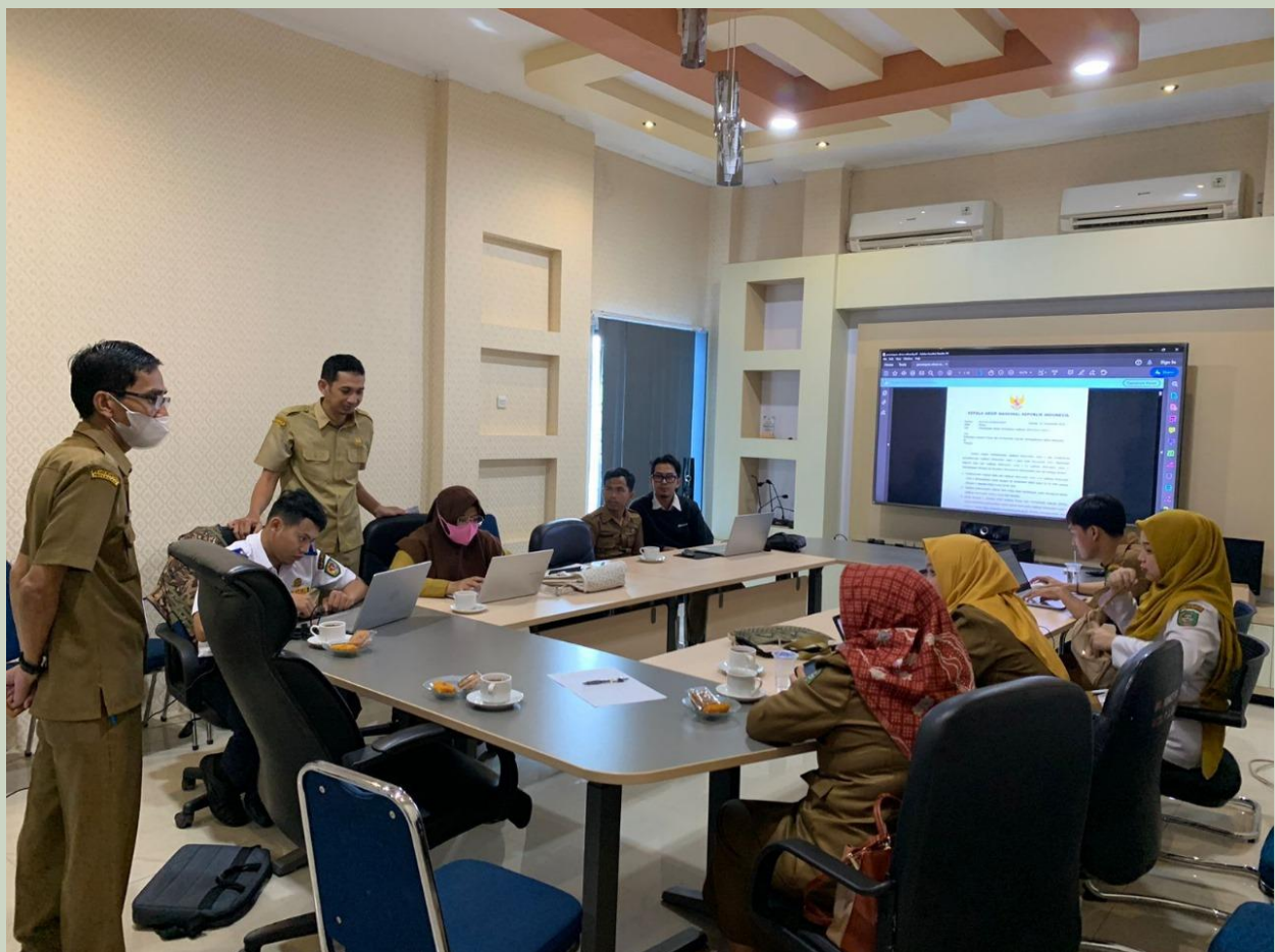
Sosialisasi dan Asistensi Pengelolaan Tanda Tangan Elektronik