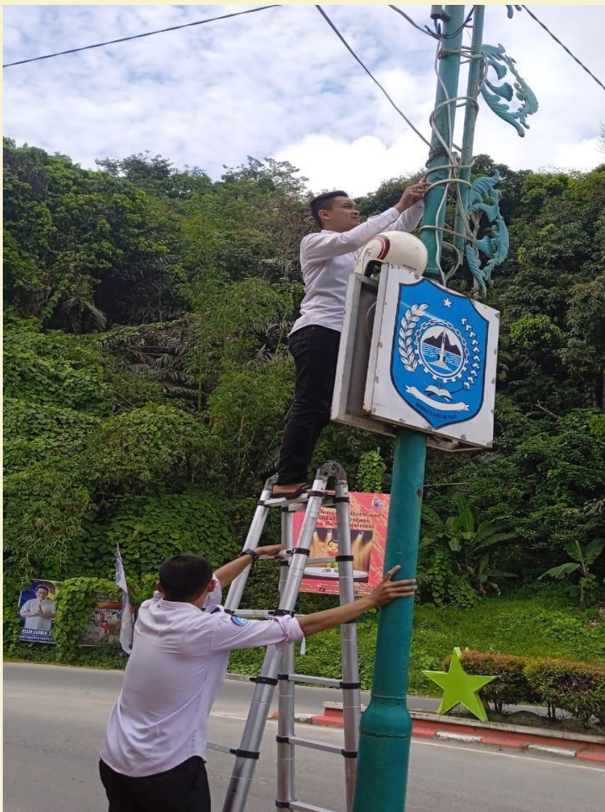
Perawatan dan Perbaikan CCTV