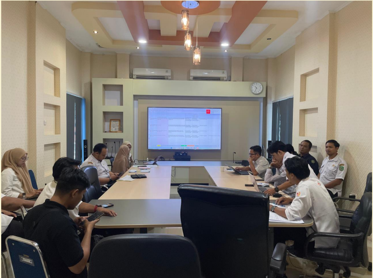
Evaluasi Penyelenggaraan Sistem Elektronik (PSE)