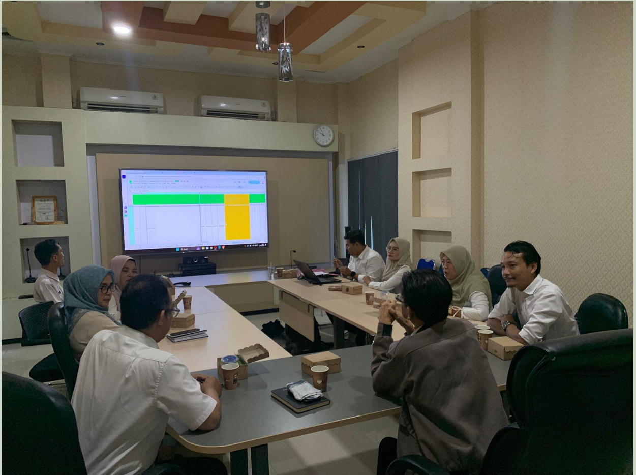
Asistensi Pengumpulan Data dan Penyusunan Standar Data dan Metadata