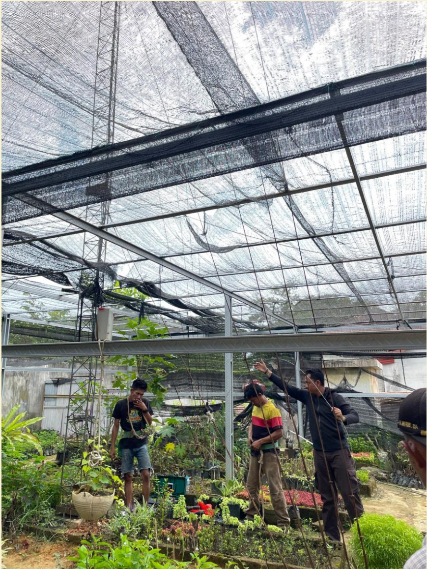
Maintenance Triangle Tower