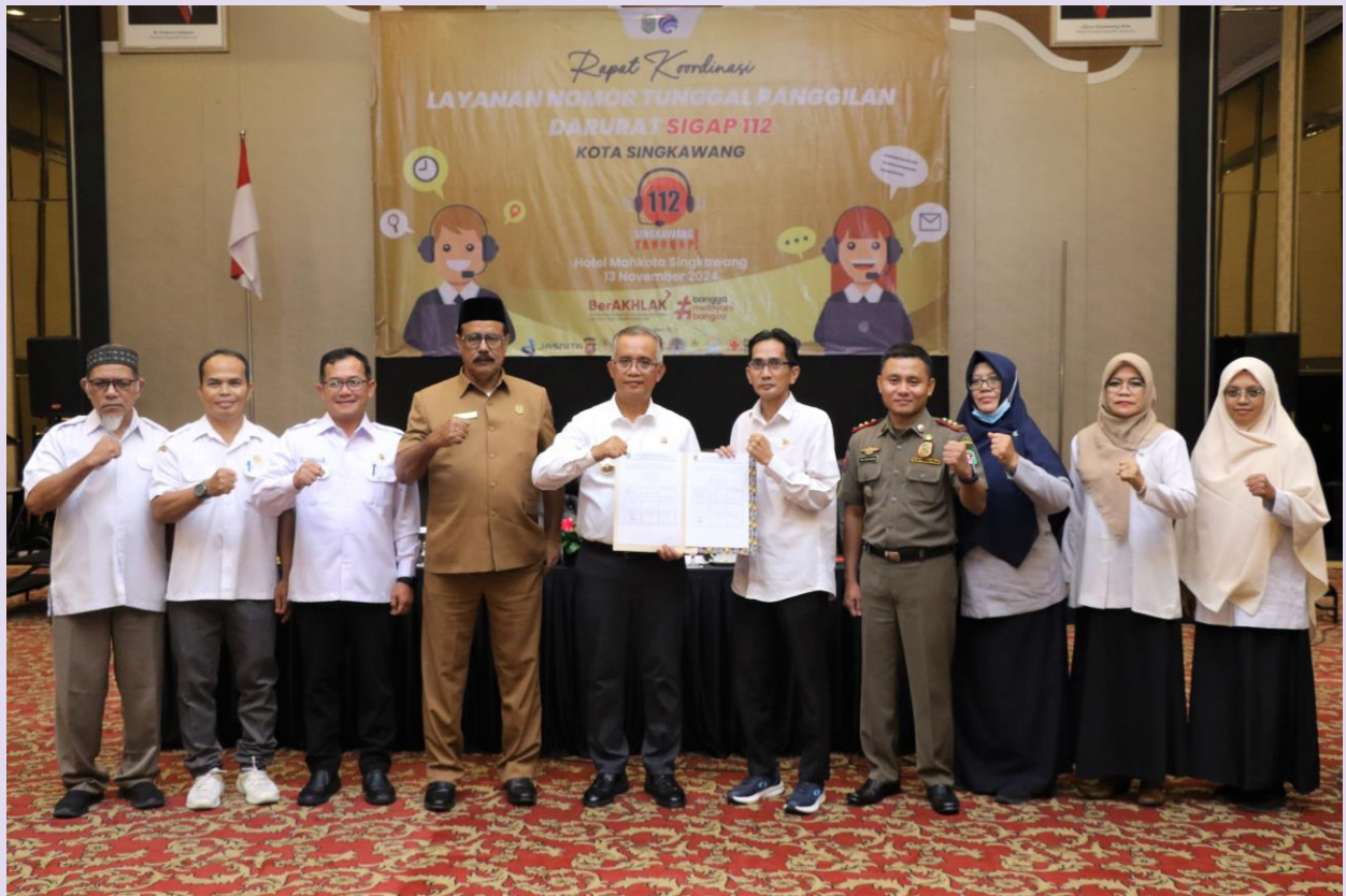
Rapat Koordinasi Nomor Tunggal Panggilan Darurat (NTPD) Layanan 112 Yang Dihadiri OPD (Organisasi Perangkat Daerah) Dan Instansi Terkait