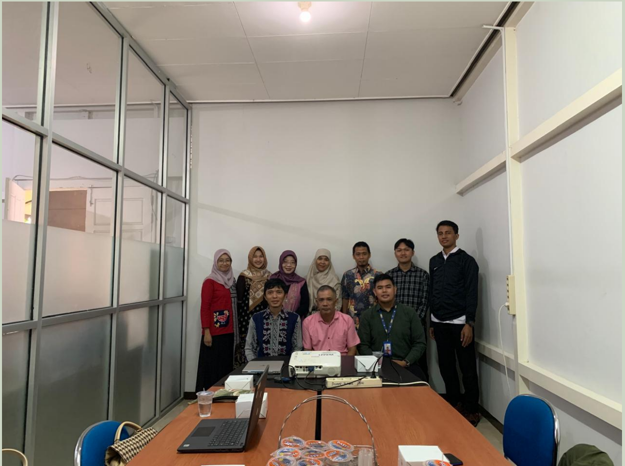
Pelatihan Analisis Data Dibidang Statistik