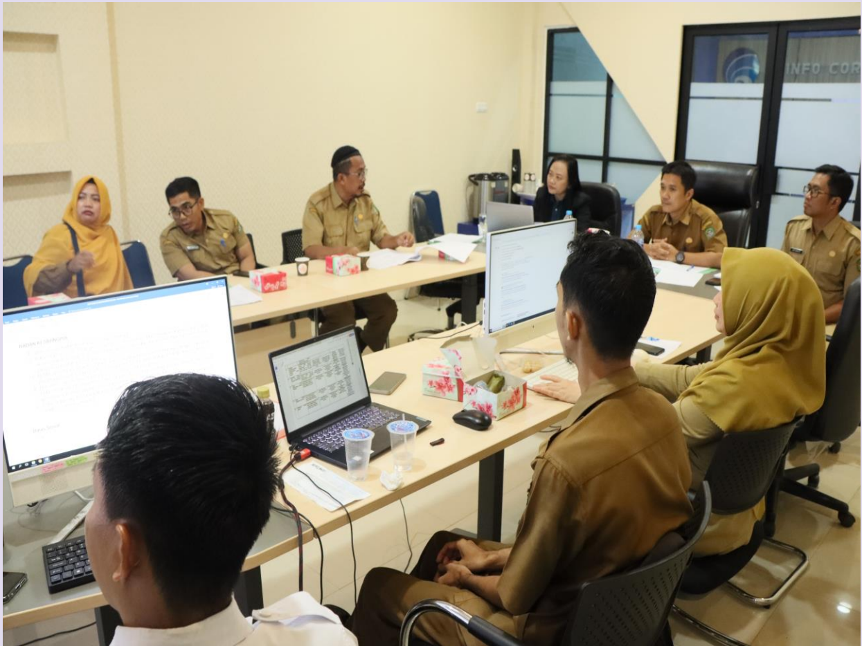
Sosialisasi Penyusunan Daftar Informasi Publik Dikecualikan Pada SKPD Pemerintah Kota Singkawang