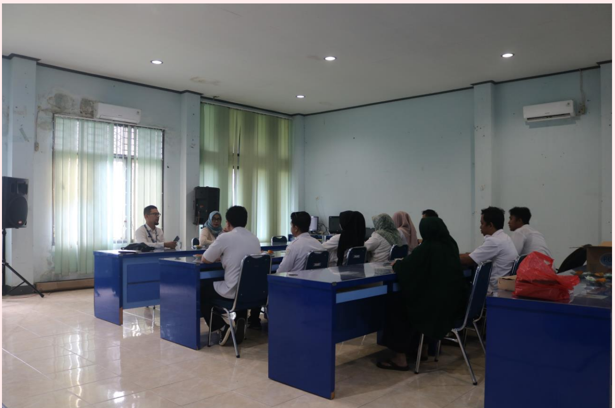
Brifing Bersama Honorer Diskominfo Kota Singkawang Dalam Persiapan Pelaksanaan Seleksi PPPK