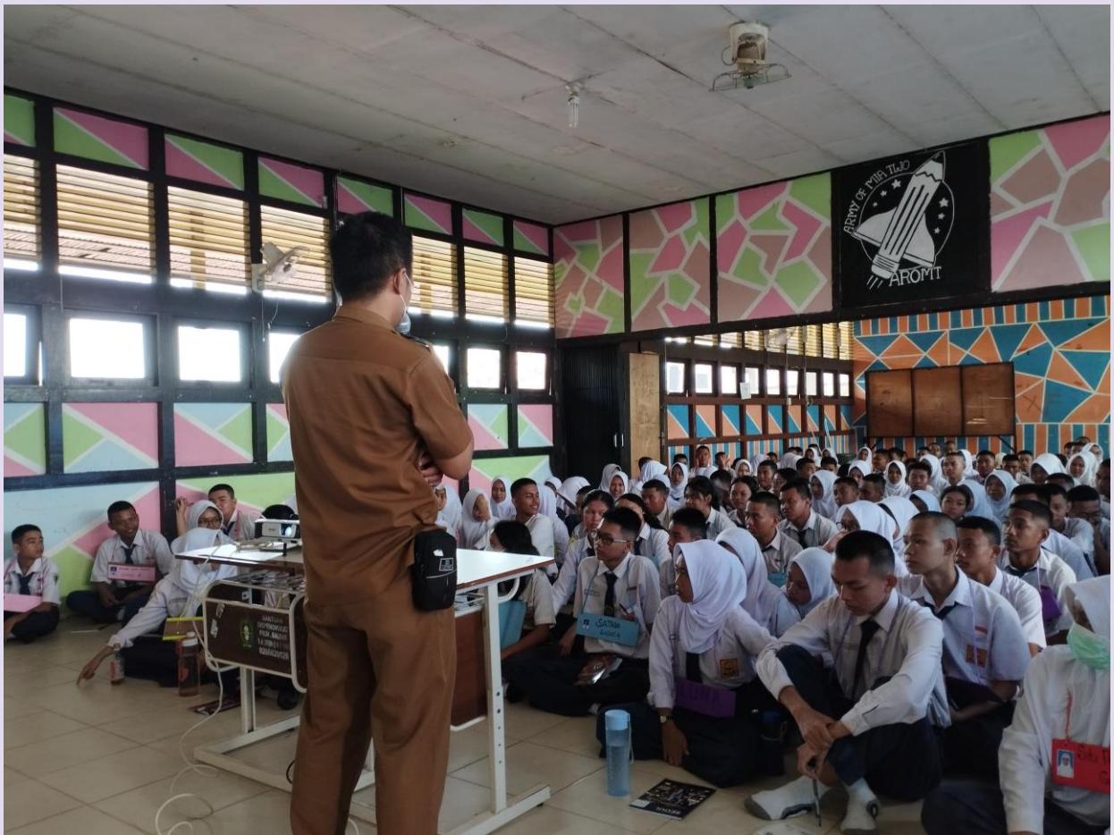
Sosialisasi Internet Sehat Dalam Rangka Bijak Bermedia Sosial