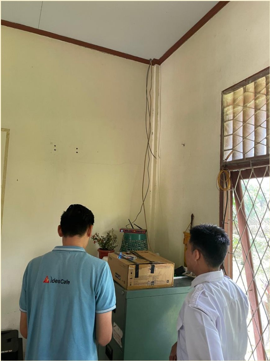
Maintenance Jaringan Internet