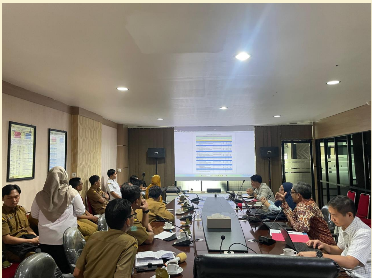
Audit SPBE Oleh BPK RI