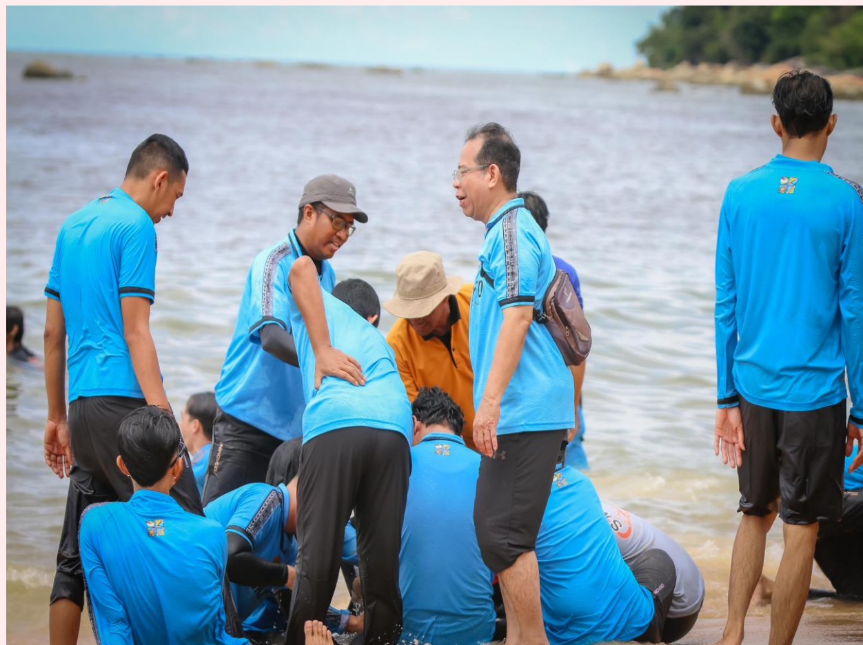
Kegiatan Outbound Dilaksanakan Dengan Tujuan Meningkatkan Kerja Sama Tim di Lingkungan Diskominfo Kota Singkawang