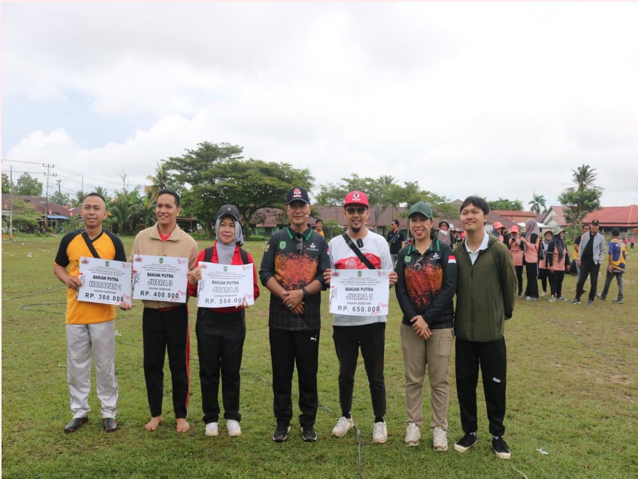
Diskominfo Kota Singkawang Mengikuti Kegiatan Lomba Antar SKPD Se Kota Singkawang Dalam Rangka HUT RI Ke 79