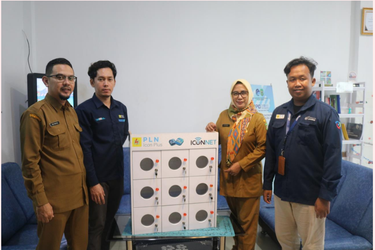
Menerima Bantuan Charger Booth Dari Icon Plus Sebagai Partisipasi Pihak Ketiga Dalam Upaya Peningkatan Mutu Pelayanan