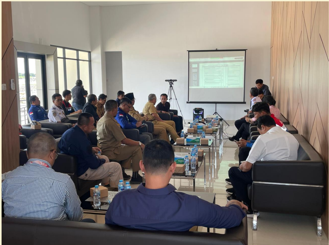
Video Conference Persiapan Persemian Bandara Kota Singkawang