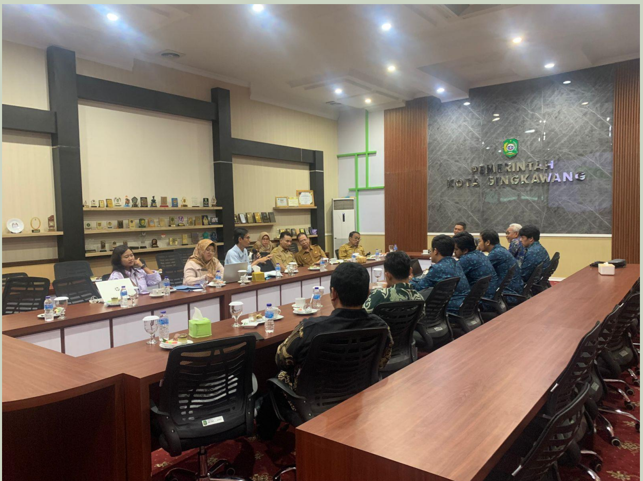
Paparan Bersama Pusat Teknologi Informasi Sekretariat DPR RI Tentang Penyelenggaraan Satu Data Indonesia Kota Singkawang