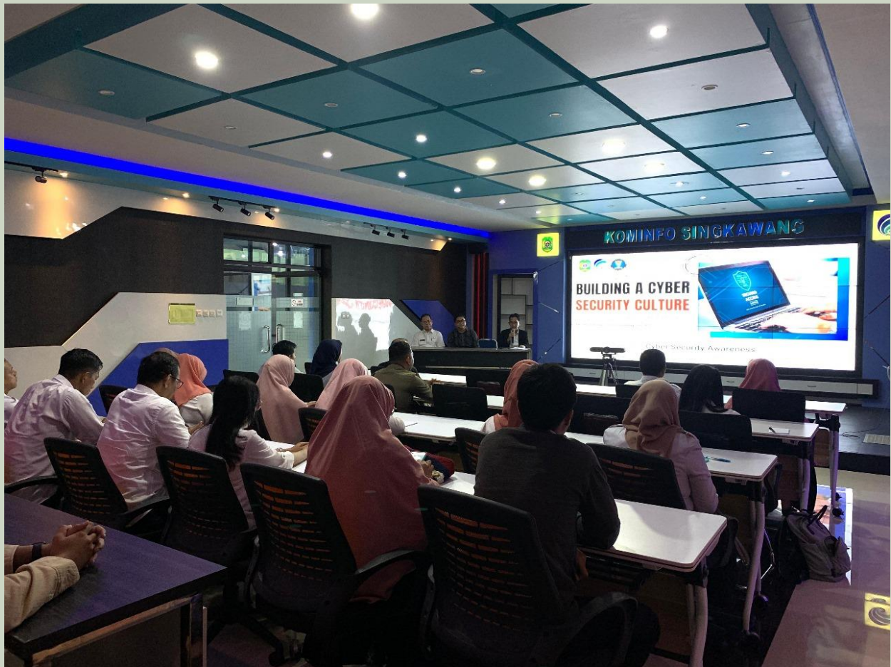
Sosialisasi Security Awareness