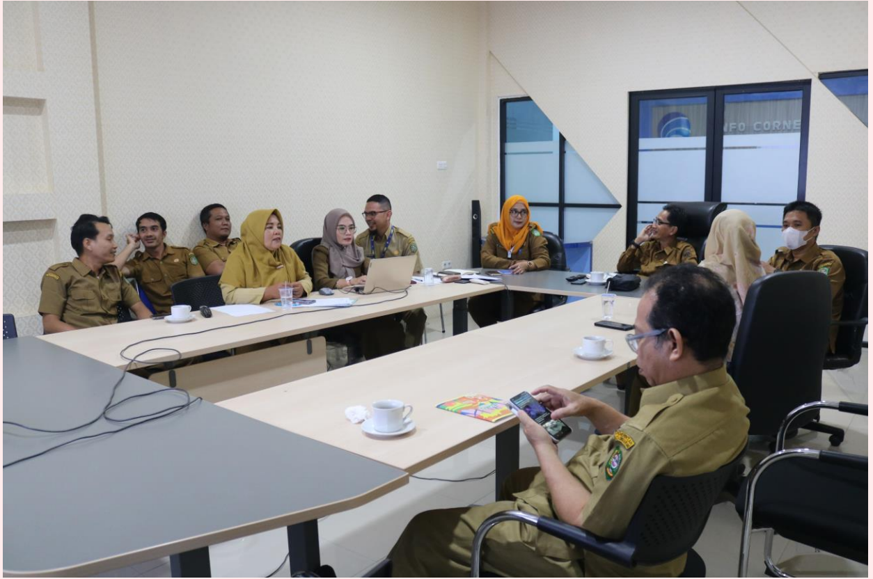
Aksi Perubahan Yang Dilaksanakan Oleh PNS di Lingkungan Diskominfo Kota Singkawang Pada Pelaksanaan Pelatihan Kepemimpinan Sebagai Upaya Transpormasi Pekerjaan Agar Lebih Efektif Dan Efesian