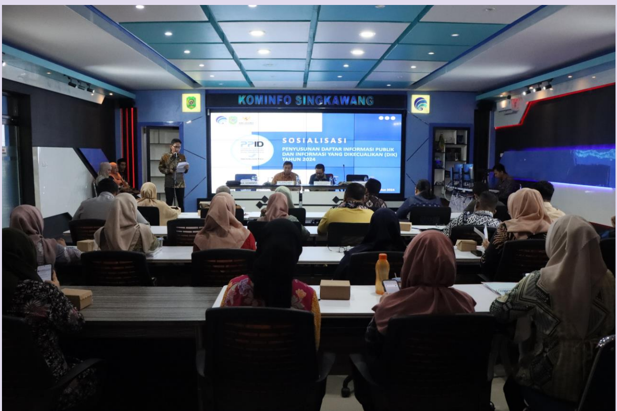
Sosialisasi Pejabat Pengelola Informasi dan Dokumentasi (PPID) Kepada Organisasi Perangkat Daerah (OPD) se Kota Singkawang